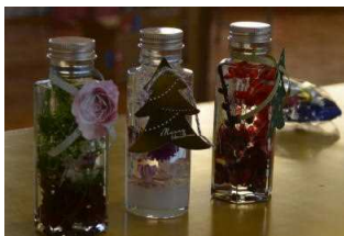
素敵な作品ができました。