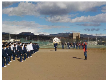
東部消防署長の話

これからの季節、火気を扱う機会も増えるとともに空気が乾燥し火災が発生しやすくなっています。火の元には十分注意をしていきましょう。