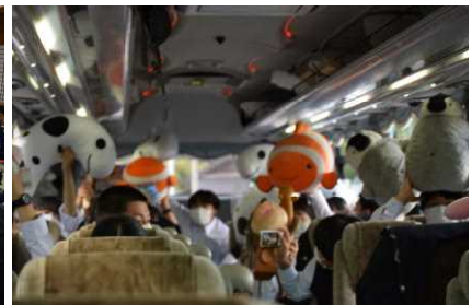
帰りのバスの中で