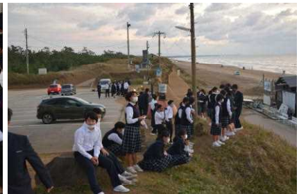
なぎさドライブウェイ