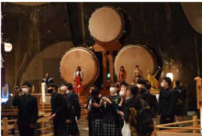
飛騨高山まつりの森